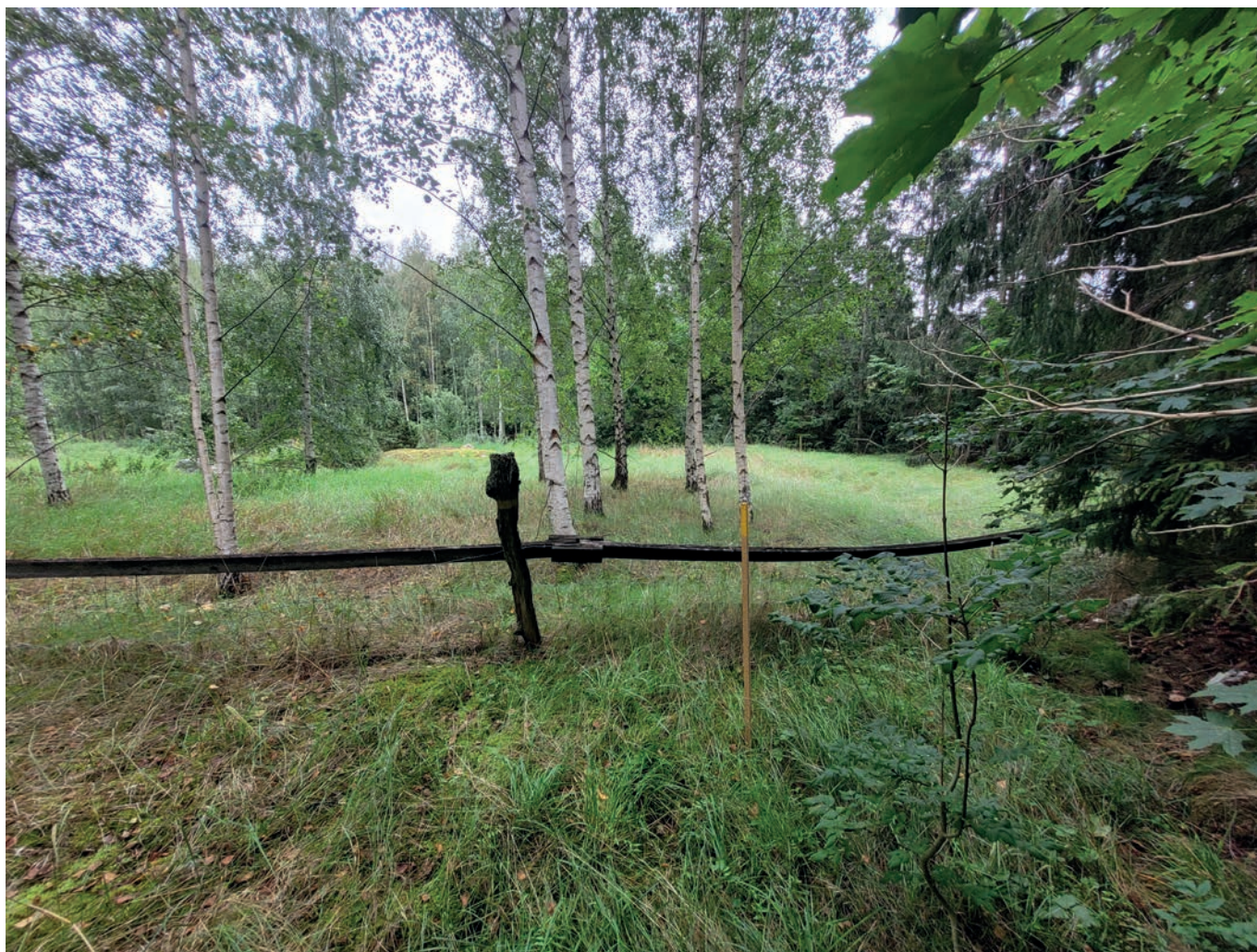
Figur 1. För detta åkermark med björkplantering i utredningsområdets västra del. I bakgrunden ans höjden.

Vid fältinventeringen noterades en lämning som statusförändrades till fornlämning (L1943:5244). Strax norr om utredningsområdet, utanför aktuellt uppdrag, noterades ytterligare en fornlämning.