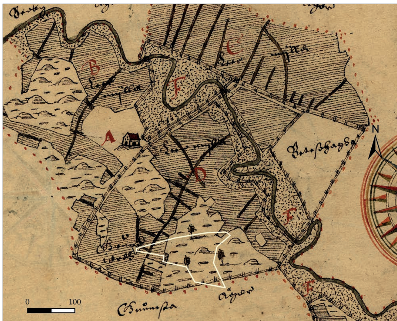
Figur 4. Utredningsområdets läge i relation till 1640 års karta. Utredningsområdet är markerat med vit linje. Åby gårds bebyggelse återfinns vid kartans A. Notera att Åbys ägor finns på ömse sidor om Lillån. Skala 1: 5 000.

Åby omtalas första gången år 1395. 1540 består Åby av en skattegård om 12 öresland (DMS 1:3, s. 249). 1395 fanns av allt att döma två gårdar i Åby enligt en tiondelängd från Funbo kyrkas medeltida räkenskaper. Det tyder på att Åby tidigare under medeltid bestått av två gårdar (DMS 1:3, s. 231). Gunsta omtalas första gången år 1355. 1540 finns här två skattegårdar på vardera 10 öresland (DMS 1:3, s. 236).