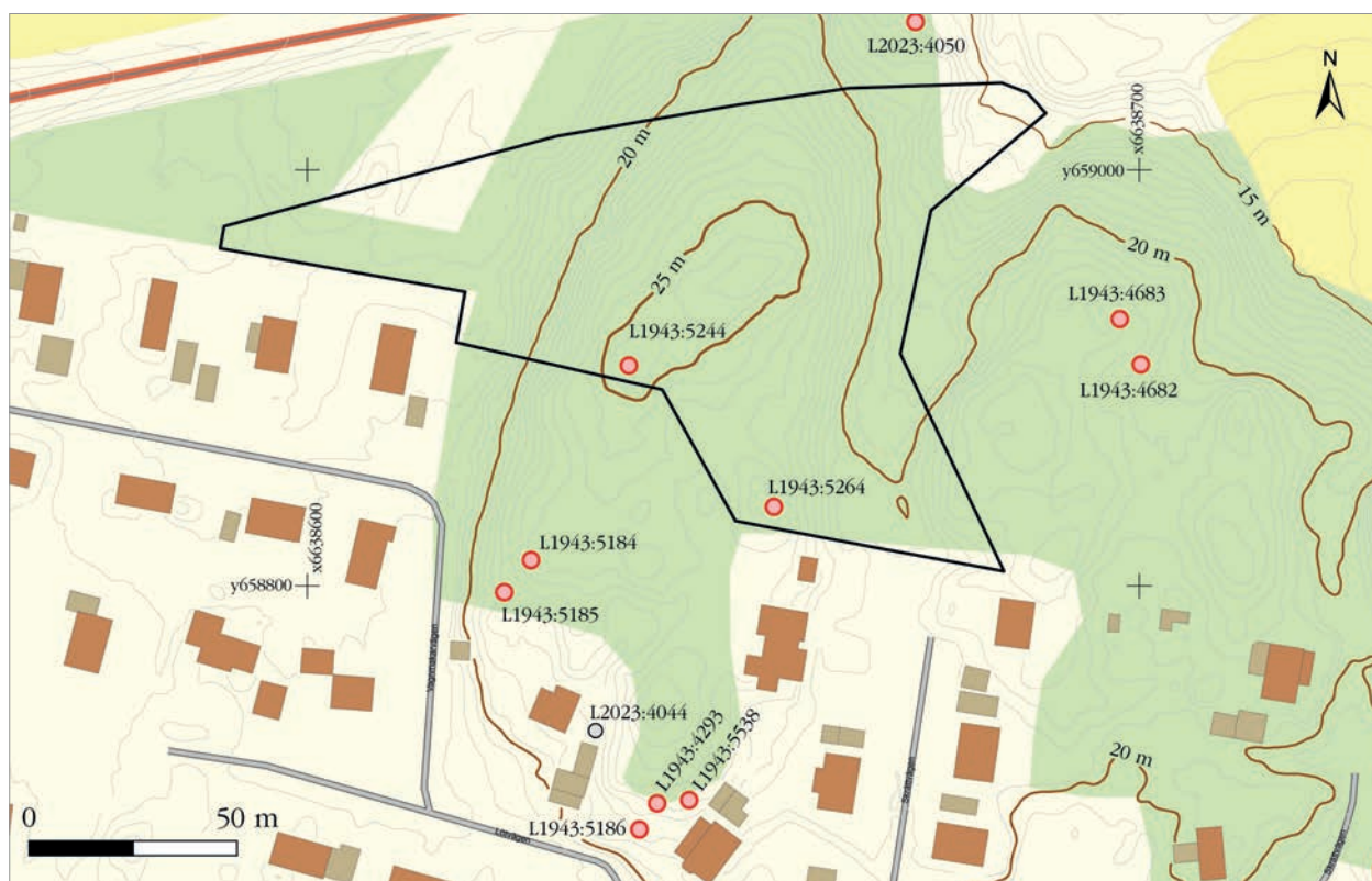
Figur 6. Karta över utredningsområdet med lämningar. Skala 1:2 000.

Vid fältinventeringen noterades två objekt, varav det ena låg utanför utredningsområdet och därmed inte omfattades av detta uppdrag. De utgörs av gravar i form av stensättningar. Objekt 1 innebär en omtolkning av L1943:5244 som före utredningen hade lämningstyp som fornlämningsliknande bildning.