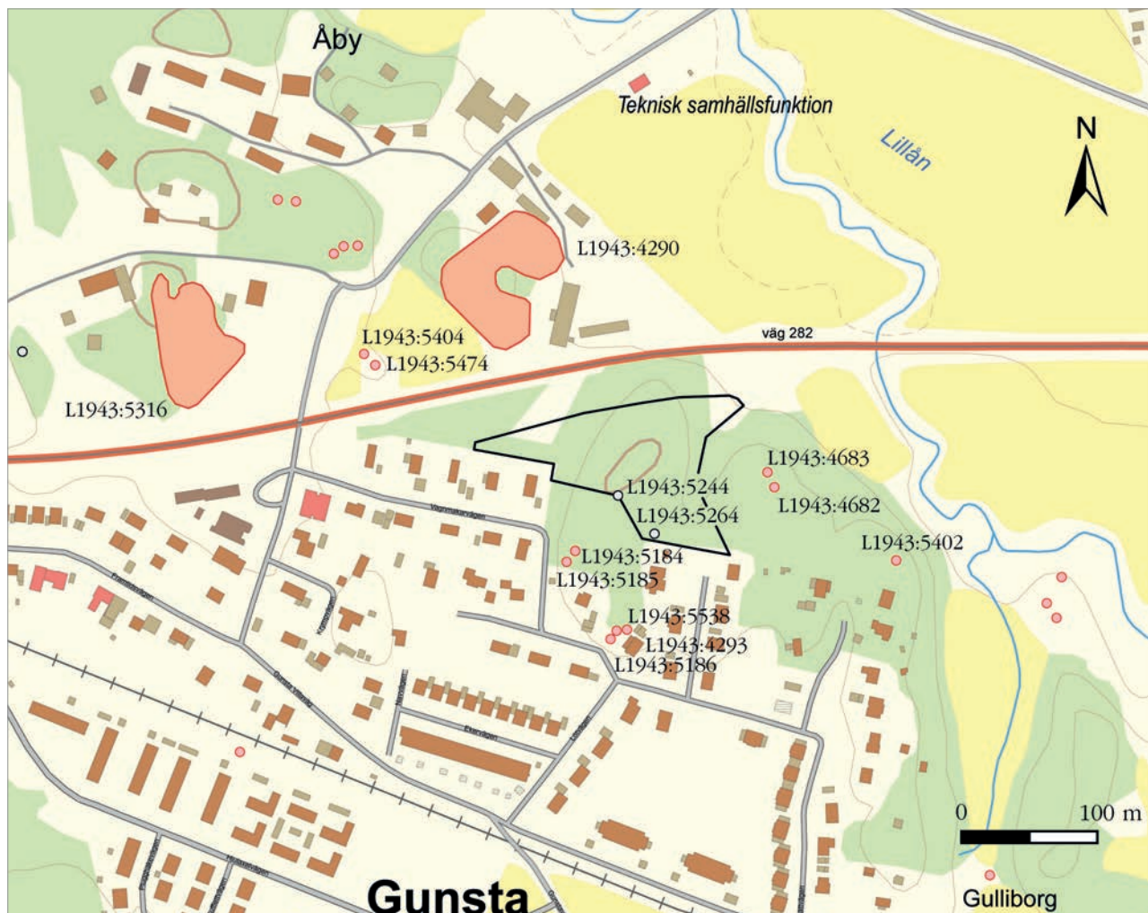
Figur 3. Utredningsområdet (svart linje) med i texten omnämnda fornlämningar markerade. Karta: Topografi 10, skala 1:5 000.

Funboområdet har ett svagt kuperat odlingslandskap med mindre moränbackar där de flesta fornlämningarna är lokaliserade. De senare utgörs framför allt av lämningar från järnålder som fornborgar, gravar och gravfält, runstenar och stensträngar (U 26 Funbo F B, Kulturmiljöer i Uppsala kommun). Från bronsålder är troligen de 20-tal skärvstenshögar i Funbo. I jämförelse med motsvarande områden närmare Uppsala finns påfallande få kända boplatser (3 enligt Fornsök). Sedan sekelskiftet 2000 har ett större bostadsområde byggts ut i Gunsta och flera områden för bostäder är under planering.