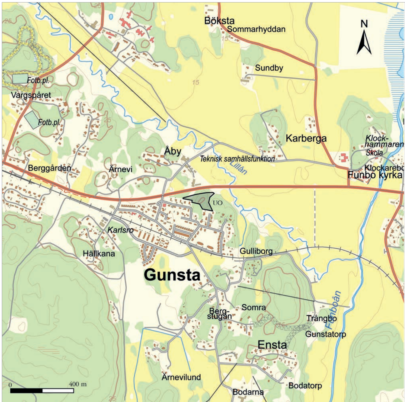
Figur 2. Kartan visar utredningsområdets läge i förhållande till Gunsta, väg 282 och Lillån. Karta: Topografi 10, skala 1:15 000.

var Axel Bodén. Den arkeologiska utredningen gjordes efter beslut av Länsstyrelsen i Uppsala län (diarienummer 431-4042-2023). Projektledare för Upplandsmuseet var Per Frölund som också författat rapporten.