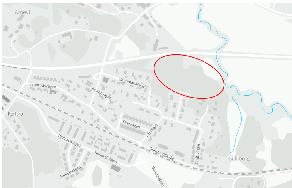
Figur 2. Planområdets ungefärliga läge i Gunsta.

Planförslaget innebär en förändrad markanvändning då: