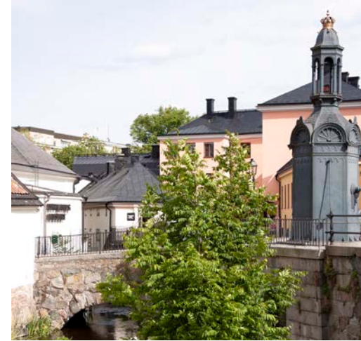
S:t Eriks källa. Över källan restes på 1850-talet ett pumphus tillverkat i gjutjärn av Hällefors bruk.

Enligt legenden dödades kung Erik Jedvardsson den 18 maj 1160 vid den plats där domkyrkan ligger nu. Han överraskades efter mässan av den danska prinsen Magnus Henrikssons knektar. Vid striden blev Erik halshuggen. Huvudet rullade nedför Domberget mot Fyrisån. Där det stannade och blodet rann ner sprängde genast friskt källvatten fram, nuvarande S:t Eriks källa.