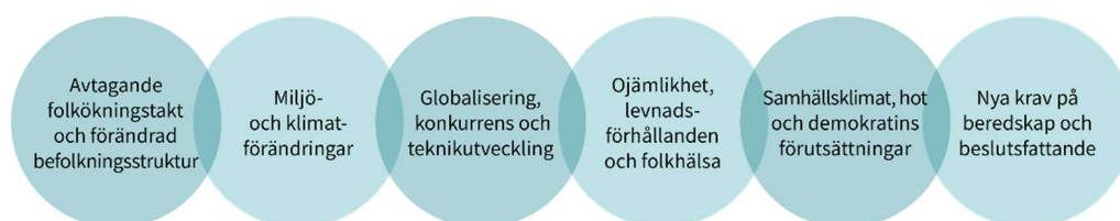
Figur 1. De sex övergripande omvärldstrenderna i Uppsala kommuns omvärldsanalys. 1) Avtagande folkökningstakt och förändrad befolkningsstruktur, 2) Miljö- och klimatförändringar, 3) Globalisering, konkurrens och teknikutveckling 4) Ojämlighet, levnadsförhållanden och folkhälsa, 5) Samhällsklimat, hot och demokratins förutsättningar, samt 6) Nya krav på beredskap och beslutsfattande.

Omvärldsrapporten inleds med en beskrivning av olika omvärldstrender (Figur 1). Syftet är att försöka fånga viktiga sakförhållanden och bakomliggande trender som sannolikt kommer sätta ramarna för den framtida utvecklingen. Till varje trend presenteras slutsatser i punktform – förändringstryck – som beskriver vad kommunen kan göra för att möta de skeenden som trenderna pekar på. Rapporten avslutas med en redogörelse av bedömningar om den svenska ekonomins utveckling och Uppsala kommuns ekonomiska förutsättningar under de närmaste åren.