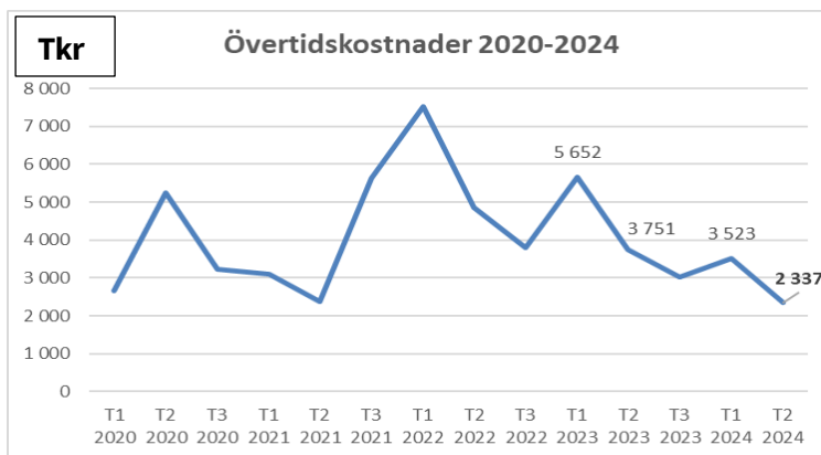
Diagram 3. Övertidskostnader 202001 - 202408

Från diagram 3 ovan, framgår att under tertial 1 och 2 år 2024, har övertidskostnaderna minskat med 3 miljoner kronor mot föregående år. Kostnaderna har gått från 1,4 procent av total lönekostnad till 0,8 procent.