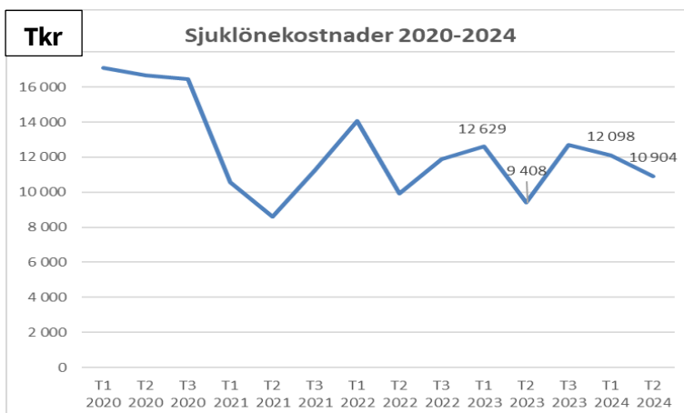
Diagram 4. Sjuklönekostnader 202001-202408

Från diagram 4 ovan, framgår att sjuklönekostnaderna under tertial 1 och 2 år 2024, motsvarar ungefär samma kostnadsnivåer som föregående år motsvarande period. Andelen sjuklönekostnader av total lönekostnad har även stått still på 3,4 procent.