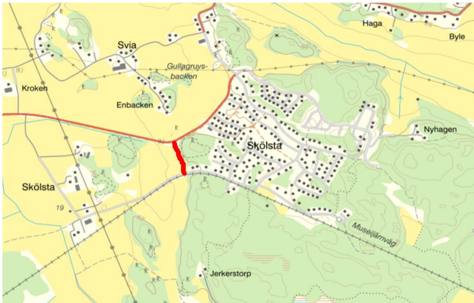
Karta över Skölsta med ny väg markerad