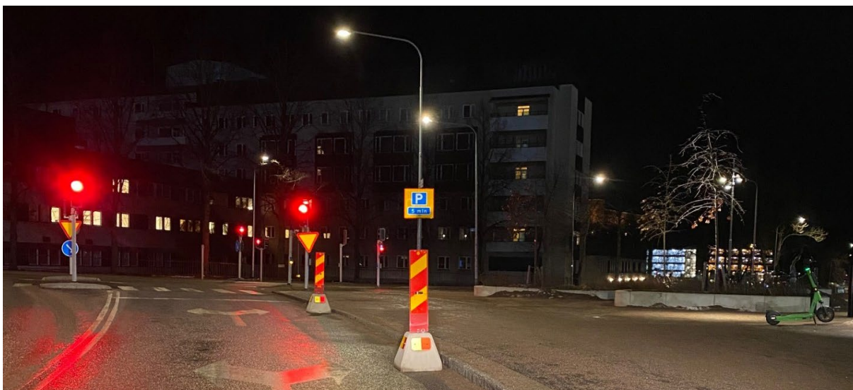
Bild 1) Foto av korsningen Slevan Säfwenbergs väg och Sjukhusvägen, sett söderifrån.

Med anledning av ovanstående vill jag fråga Gatu- och samhällsmiljönämndens ordförande, Rafael Waters: