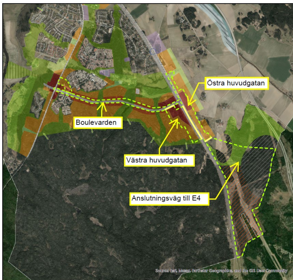
Figur 1. Karta över de fyra delprojekt inom Väginfrastruktur i Sydöstra stadsdelarna. Östra huvudgatan markerad med streckad linje på del av bilden.