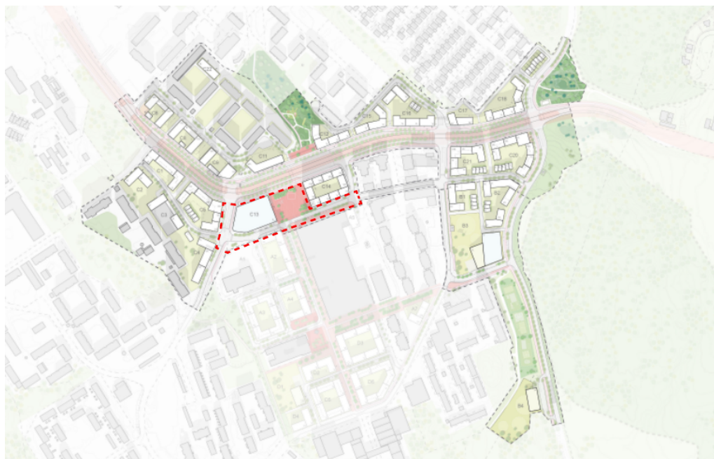
Situationsplan över samrådsförslaget för Gottsunda stadsstråk. Ungefärligt planområde för Gottsunda stadsstråk etapp 1, som denna undersökning berör, är markerad med röd streckad linje.

Planförslaget innebär en förändrad markanvändning då: