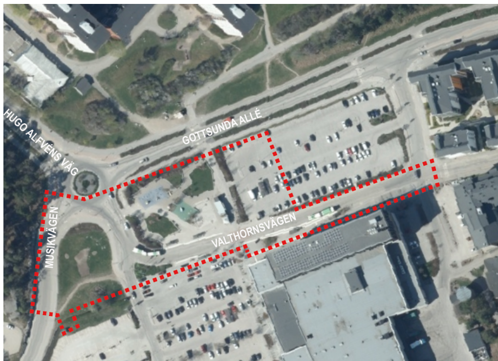
Ortofoto som visar planområdets ungefärliga avgränsning med röd streckad linje.