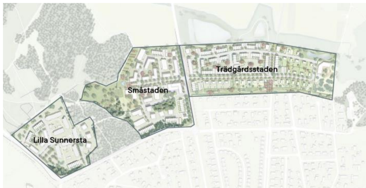
Figur 3. Illustrationsplanen visar planområdet uppdelat i tre karaktärsområden; "trädgårdsstaden", "småstaden" och "lilla Sunnersta".