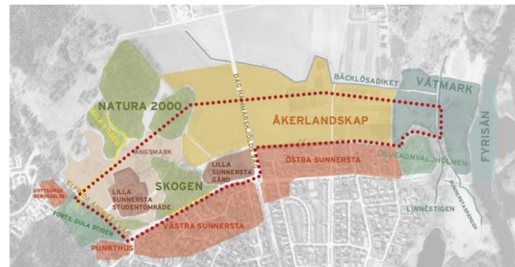
Figur 2. Illustration som visar planområdets befintliga markanvändning, inklusive befintlig bebyggelse.