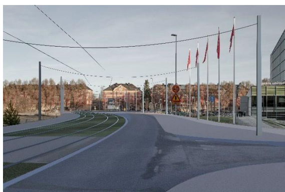
Regementsvägen med stolpar cc25 meter förbi Ångström