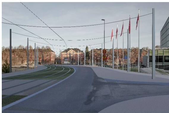
Regementsvägen med stolpar cc15 meter förbi Ångström.