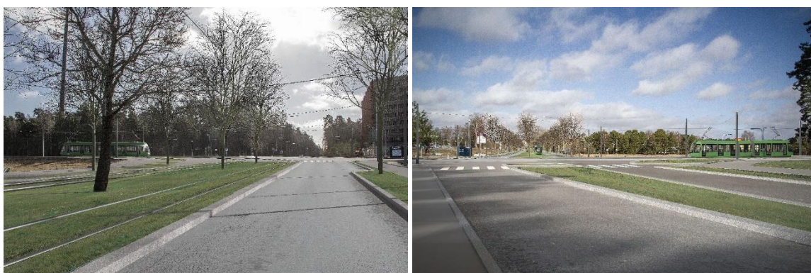
Korsningen Dag Hammarskjölds väg/Regementsvägen med kontaktledningar.