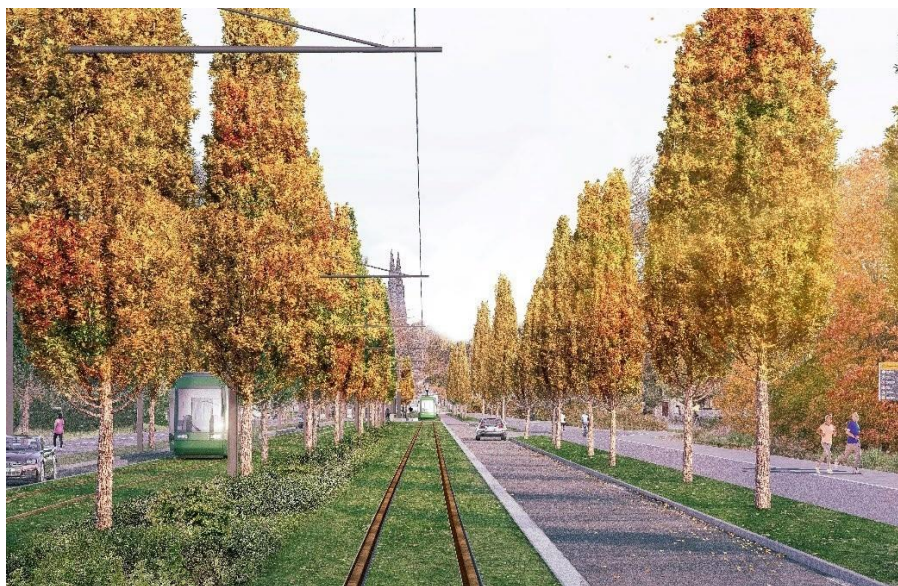
Dag Hammarskjölds väg med mittstolpe.

Stadens framväxt och struktur De kilometerlånga raka infartsvägarna är en förlängning och viktig del i rutnätsplanen och planerade så att upplevelsen av Uppsala slott och domkyrkan blir mycket imponant. Stadsplanen har legat till grund för stadens fortsatta utveckling och de raka tillfartsvägarna utgör tillsammans med Fyrisån stadens bärande stråk.