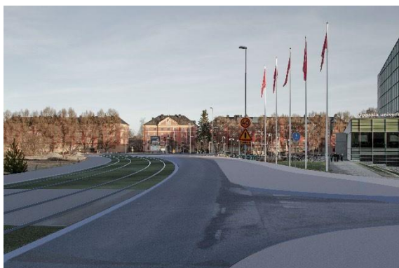
Regementsvägen utan kontaktledning förbi Ångström.