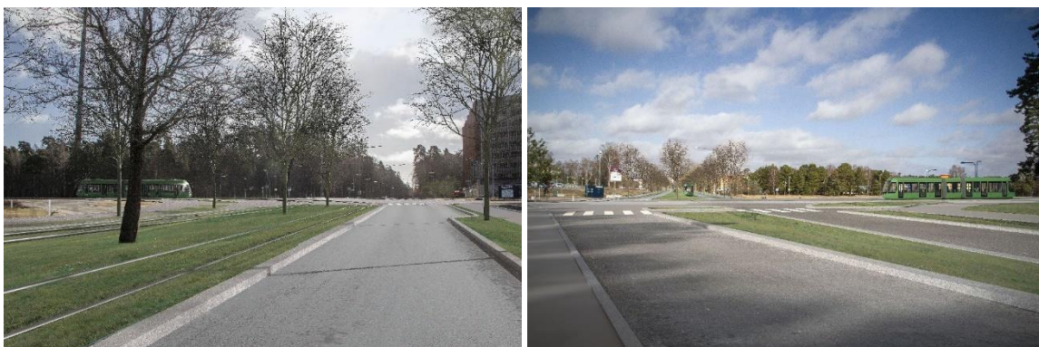
Korsningen Dag Hammarskjölds väg/Regementsvägen utan kontaktledningar.