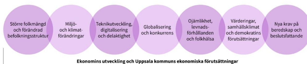
Figur 2: Omvärldsanalys 2024. Källa: Uppsala kommuns omvärldsanalys, uppdateras årligen.

Uppsala kommun och näringslivet påverkas av omvärlden och händelser som ligger utanför vår kontroll. Omvärldsanalysen 2024 lyfter fram sju övergripande trender som sannolikt kommer att påverka Uppsala både på kort och lång sikt.