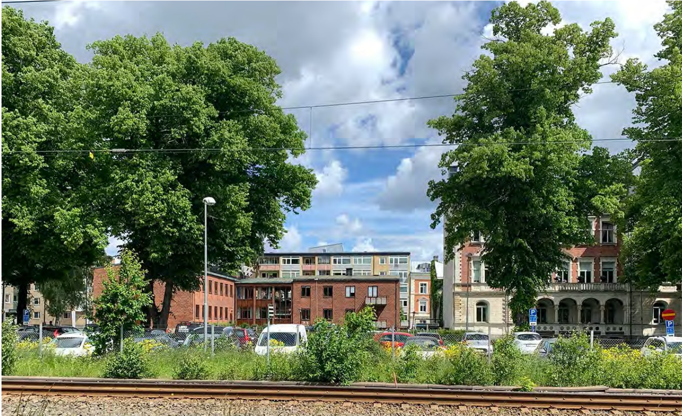
Här ses Tingshuset till vänster och det ståtliga nyrenässanshuset till höger. Vy från Järnvägspromenaden.