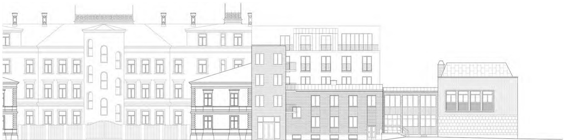
Kv. TRUDHEM, UPPSALA FÖRSLAG TILL NYA BOSTADSHUS

Huset mot Storgatan byggs på den smala tomtyta som finns mellan brandgaveln på angränsande