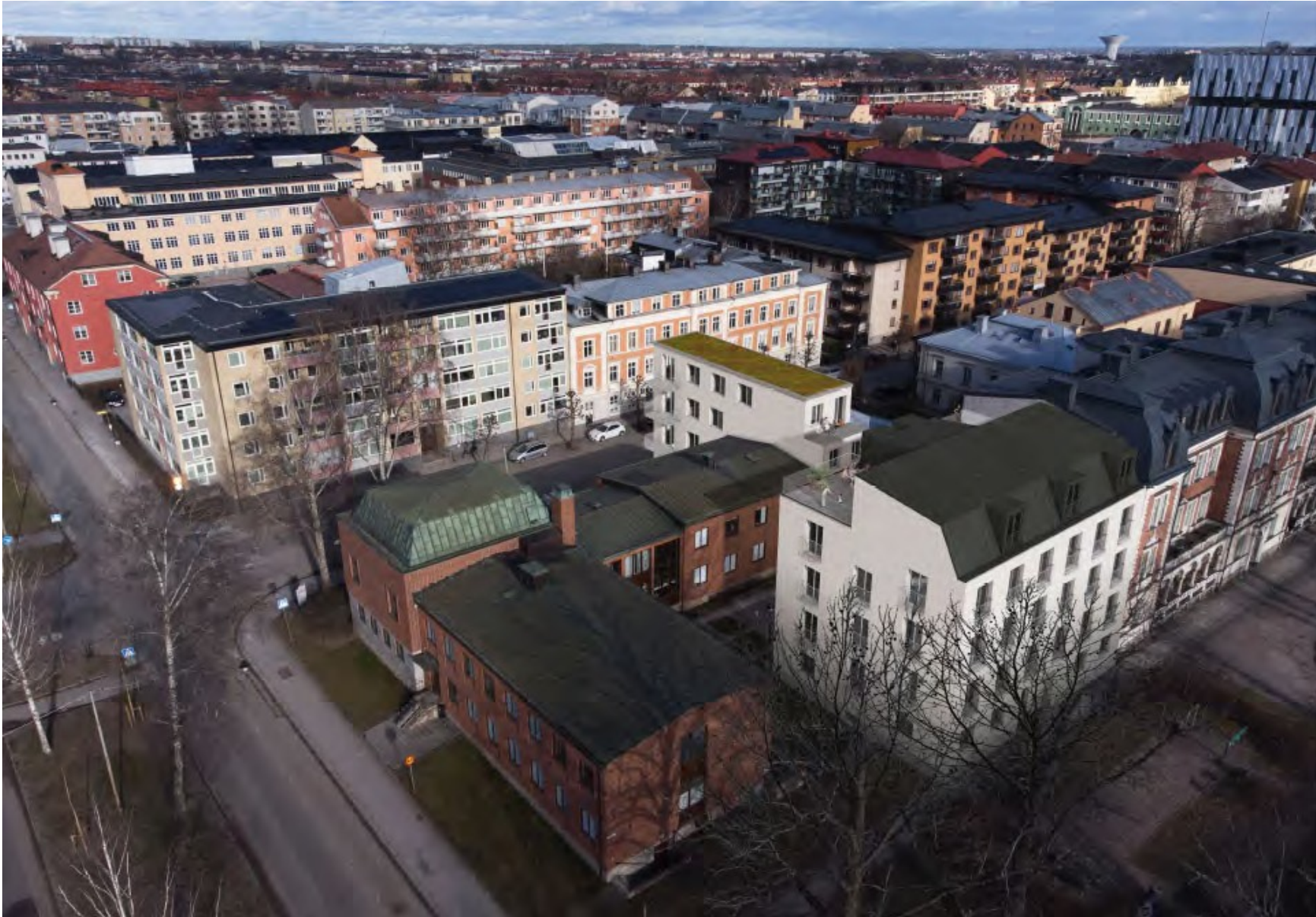
Arkitektens fotomontage med fågelvy från väster som visar de nya husens relation till omgivningen.