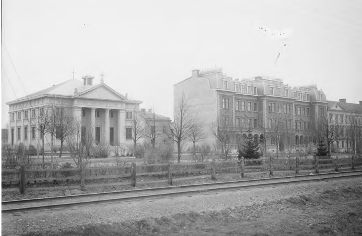
Österplans kyrksal och det ståtliga nyrenässanshuset från 1888 på Österplan 13. Fotografi från 1901 av Alfred Dahlgren. Upplandsmuseet.

Som motiv för bedömningen anges: "Konstnärligt värdefull miljö: stora stadsplanemässiga kvaliteter och i enskildheter mycket goda arkitektoniska kvaliteter av stort intresse. Social- och kulturhistoriskt värdefull miljö: av stort intresse. Variationsrikedom i form och innehåll inom enhetliga kvartersramar ger området dess karaktär och som i vissa avsnitt är mer stadsmässig än de traditionella citykvarteren".