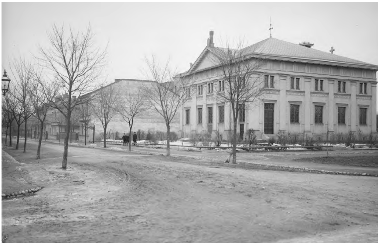
Österplans kyrksal fotograferad från korsningen S:t Olofsgatan-Storgatan. Fotografi från 1901 av Alfred Dahlgren. Upplandsmuseet.

byggdes akademiska ridstallet i kv. Trudhem vid S:t Persgatan om till fabrik för Bernhard Öbergs velocipedfabrik (sedermera Josef Eriksson och Framfabriken). 1911 byggdes ett nytt mejeri i kv. Tor på andra sidan S:t Persgatan. I kv. Njord fanns Uppsala valskvarn vid Väderkvarnsgatan som revs på 1980-talet.