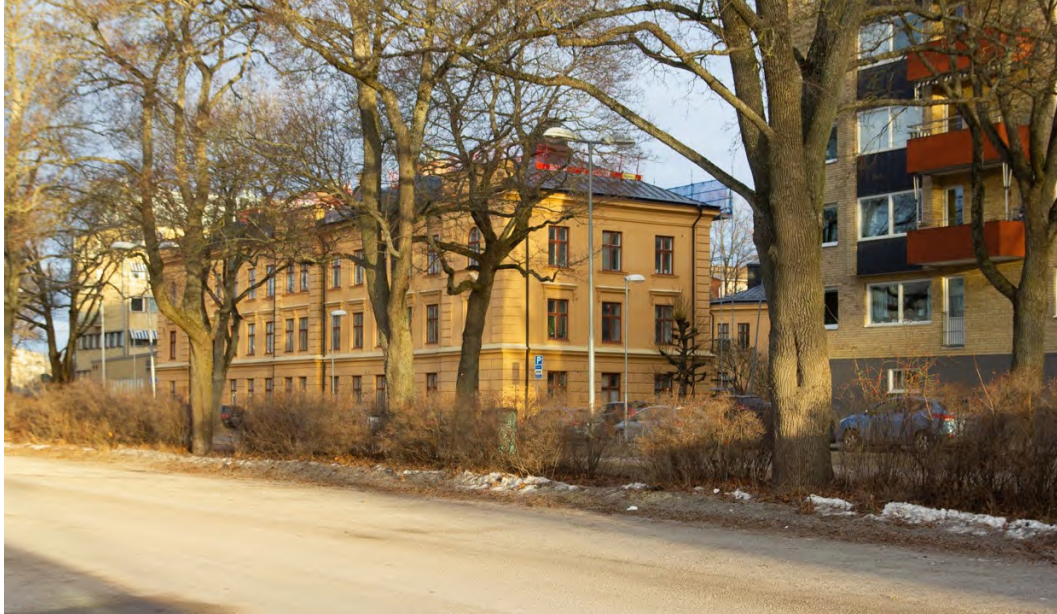
Kvarteret Folkvang sett från Österplan. Det putsade huset på Österplan 3 uppfördes efter ritningar från 1884 av Uppsala arbetarbostadsförening. Det är stadens äldsta föreningshus. Till höger ses en del av de femvåningshus i gult tegel som byggdes på 1960-talet i kv.Od.