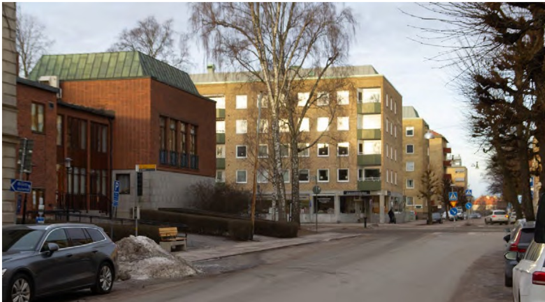
Vy från storgatan med Norra tingshuset till vänster. Mitt i bild ses de stora lamellhusen från 1960-talet i kvarteret Od.