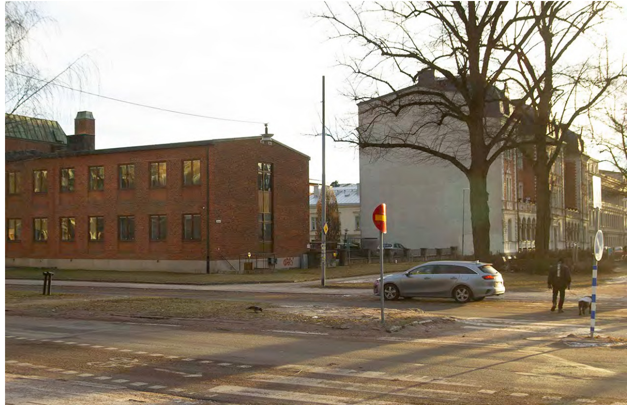
Kv. Trudhem från norr med Norra tingshuset till vänster och den höga brandgaveln på huset vid Österplan 13.

Fasaderna är tvärt avskurna upp mot taket utan markerad takfot. Det valmade, halva, sadeltaket står en liten bit indraget från fasadliv. Huset har symmetriskt placerade långsmala fönster placerade i raka rader utom bottenvåningen som har lägre fönster. Mot Österplan finns ett indraget entréparti. Huset är tänkt att inrymma smålägenheter med entré från en mittkorridor. De är, förutom på bottenvåningen, försedda med