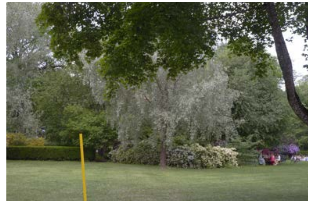
Vy från öppen grönyta, picnic