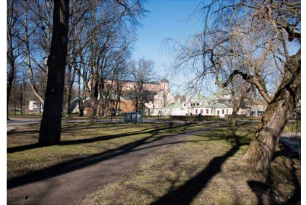
Vy 7a vintertid