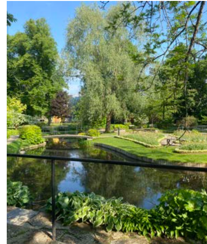
Vy från Lycksalighetens Ö. Alla bänkar riktar sig mot dammen.