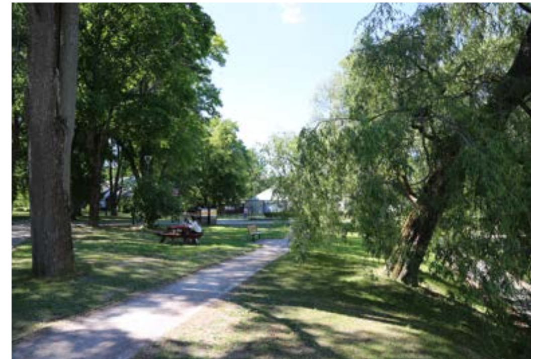
Vy 7a sommartid