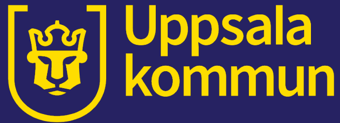
Bild på logotyp för Uppsala kommun. Bilden är ett lejon med en krona på huvudet.