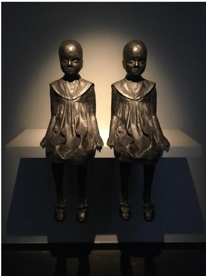
Charlotte Gyllenhammar The Smallest of Us , dark brown patina