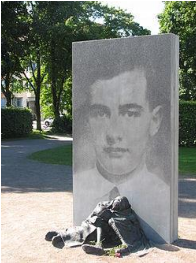
Minnesmärke Raol Wallenberg Göteborg, 2007