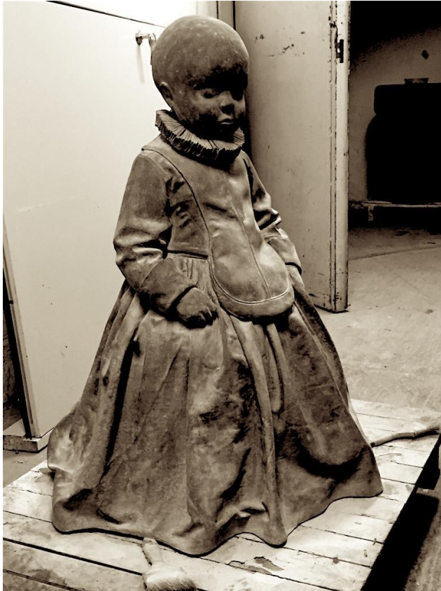
Charlotte Gyllenhammar In Waiting , black patina