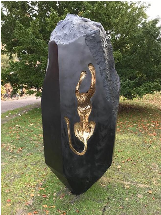
Metroite Lunds universitet 350 år 2017