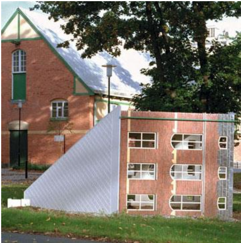
Absorbed Sthlm universitet 2001