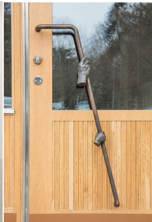
"Mamma barn" 2016