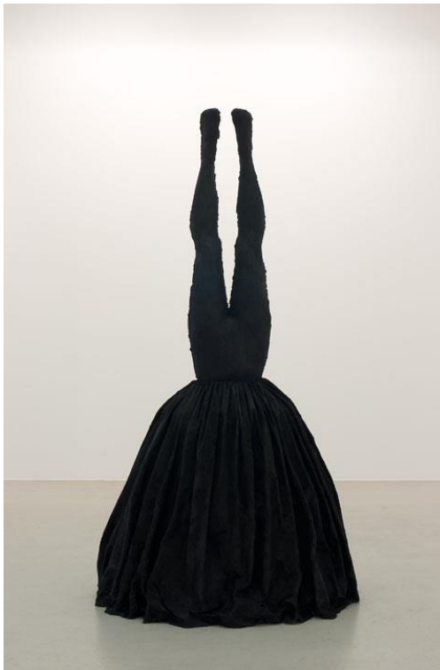
Night, descend 2014