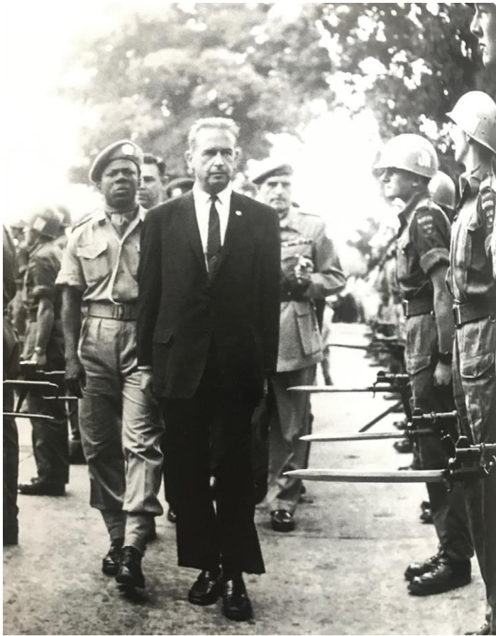
Leopoldville, Kongo år 1960