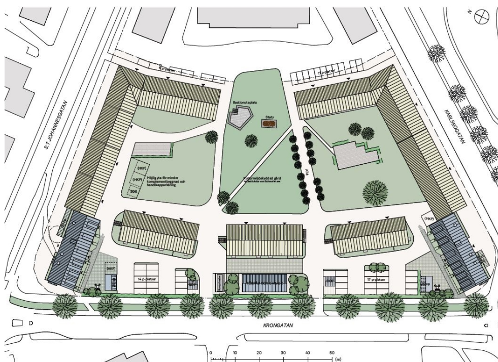
Figur 1 Illustrationsplan över planområdet. (Krook och Tjäder)

För att möjliggöra en ny byggnad längs S:t Johannesgatan övergår mark från allmänplats till kvartersmark i det norra hörnet av planområdet.