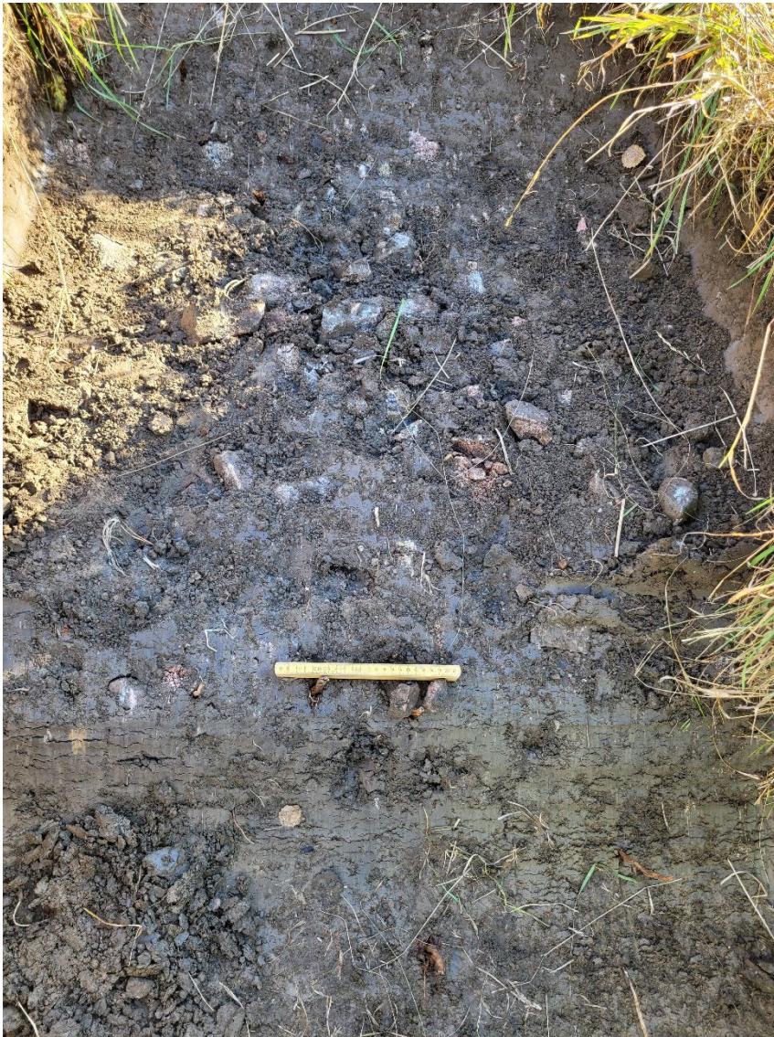
Figur 5. En av två hårdar som påträffades inom boplatsytan (objekt 3).