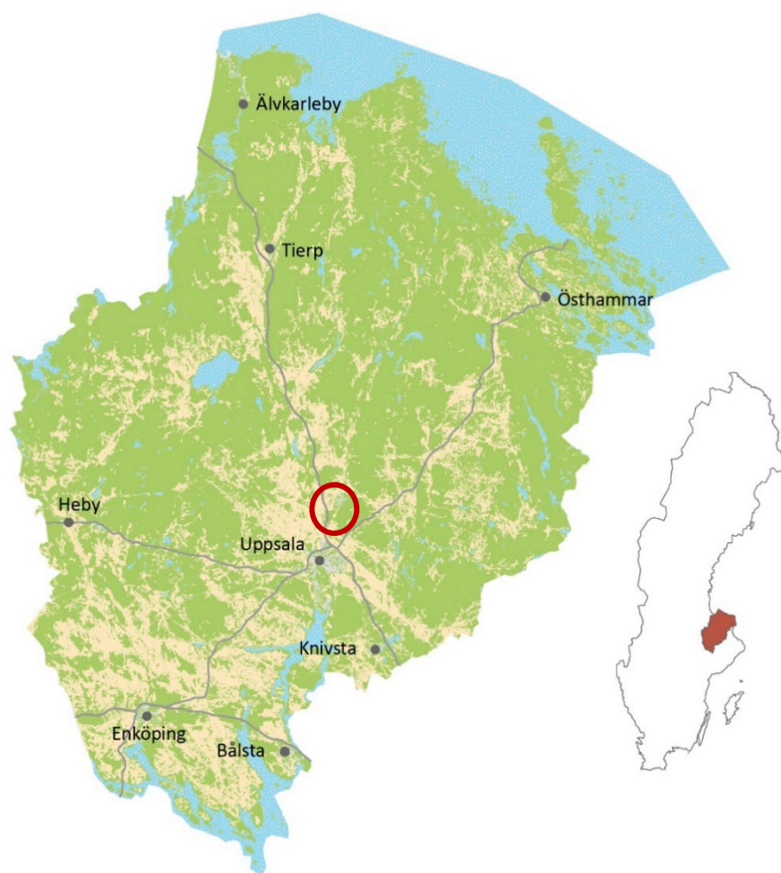
Figur 1. Karta över Uppsala län med läget för den aktuella undersökningen vid Fullerö markerad med röd cirkel.