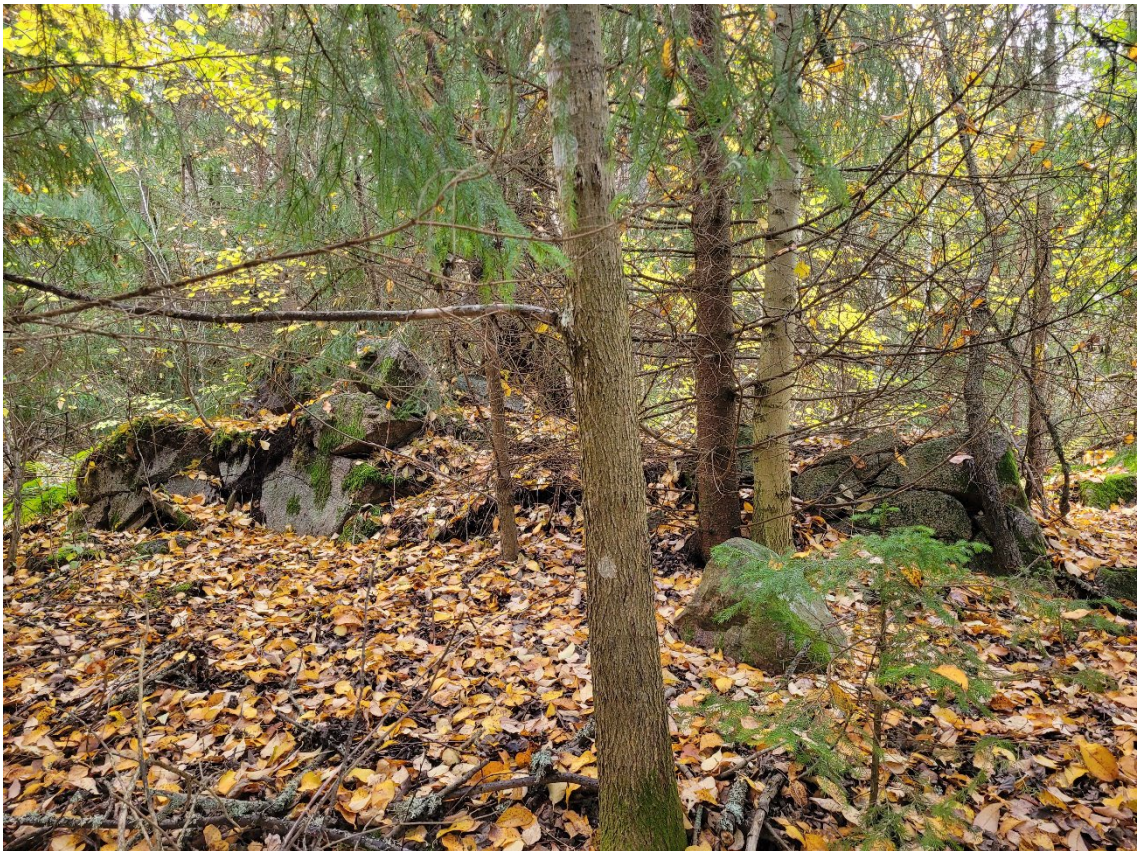
Figur 4. Objekt 2, en husgrund.