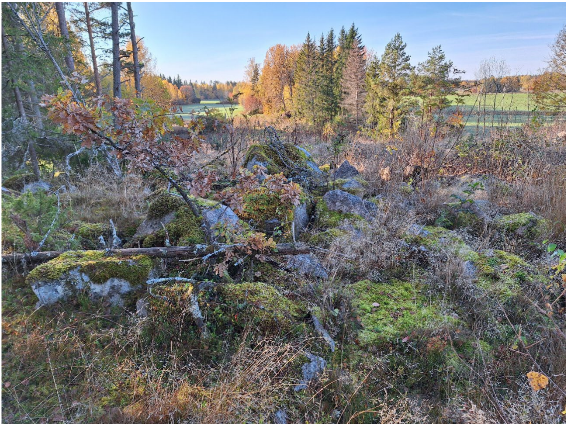
Figur 3. Den nypåträffade stensättningen (objekt 1) var 11 meter i diameter.