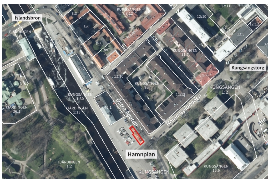
Bild 2. Flygfoto där fastigheterna i området är markerade med vita linjer. Planområdets ungefärliga läge är markerat med en röd linje.