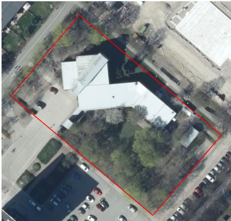
Sankt Pers kyrka med fastigheterna Kvarngärdet 31:2 och 31:3 inringade. Här syns byggnadens oregelbundna plan och trädgården i den södra delen.

Kyrkan har en oregelbunden plan där den högre kyrksalen och huvudentrén ligger i blickfånget sett från Kvarntorget. Församlingshemmet ansluter till kyrksalen i en lägre del som sträcker sig mot sydost. Utanför huvudentrén finns ett entrétorg, en stensatt yta som avgränsas av en låg mur mot nordväst och sydväst samt en hög mur och en klockstapel längs den sydöstra sidan. Via en öppning i den höga muren når man trädgården som är inhägnad åt söder och öster.