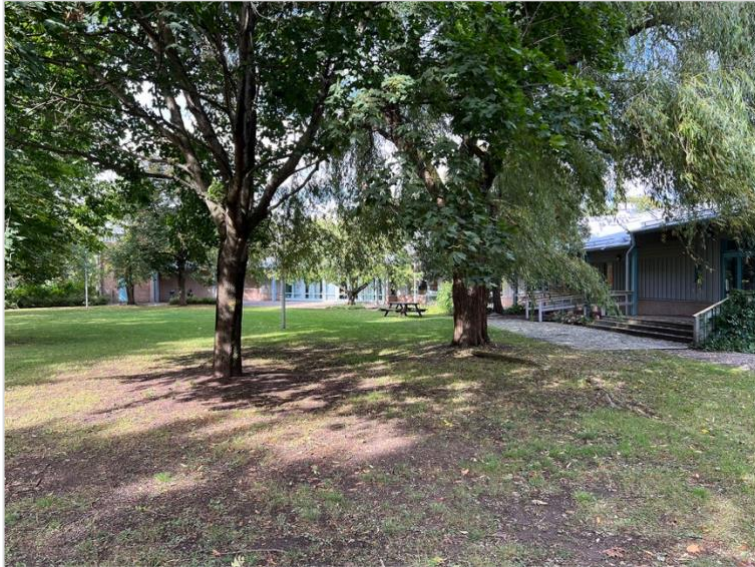
De många träden gör trädgården lummig och ger byggnaden ett inbäddat intryck.