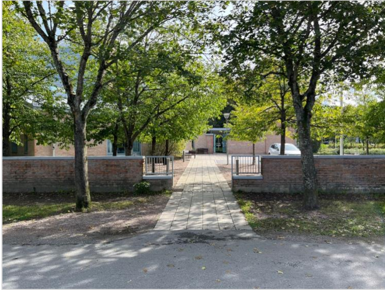
Ingången till entrétorget från gång- och cykelvägen i nordväst. Den låga muren markerar platsen men utan att upplevas som en barriär.