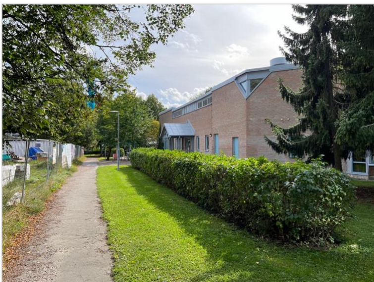
Mot Kvarngårdesskolan i nordost är byggnaden mer sluten men ändå med viss lekfullhet i gestaltningen.