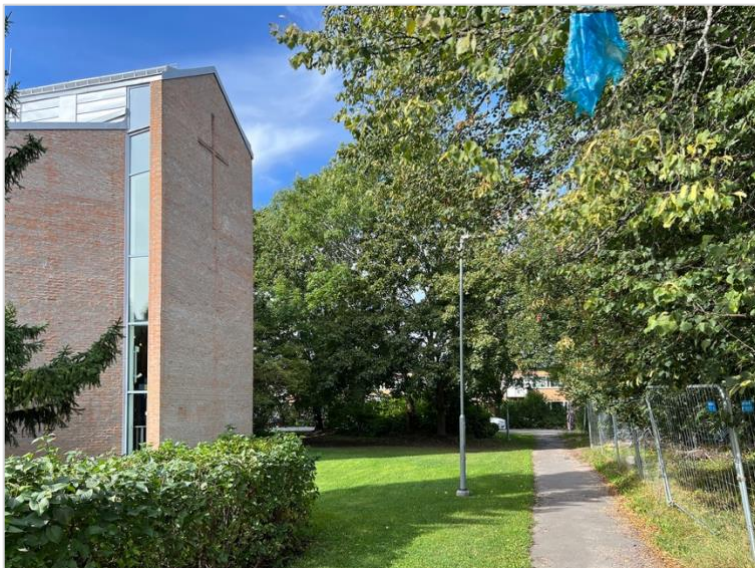
Korväggen med de höga sidoljufönstren. Utanför kyrkan möter gräsytor och träd på de omgivande fastigheterna.