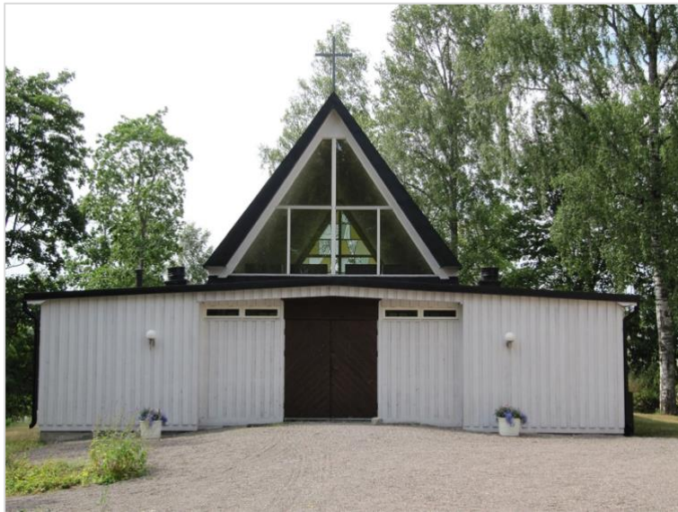
Örbyhus kyrka låg på Kvarngärdet fram till den nuvarande kyrkan uppfördes. Den så kallade vandringskyrkan är en av drygt trettio tillverkade av Oresjös fabriker AB som monteringsfärdiga byggsatser under 1960- och 70-talen. I Örbyhus fungerar den fortfarande som församlingskyrka.