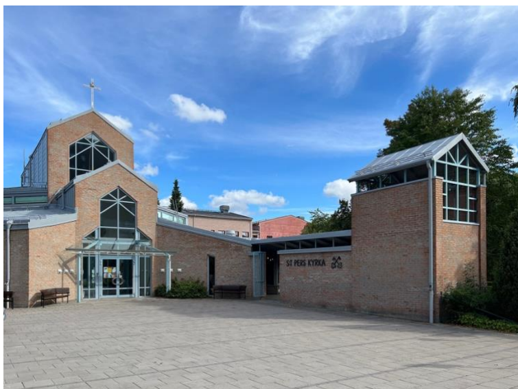
Sankt Pers kyrka sedd från sydväst med klockstapeln till höger och ingången till trädgården genom muren i mitten.