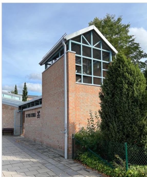
Klockstapeln står fritt men binds samman med kyrkobyggnaden av en mur. Trots dess moderna formspråk och relativt lilla skala står den som en kampanil med tydliga historiska referenser.