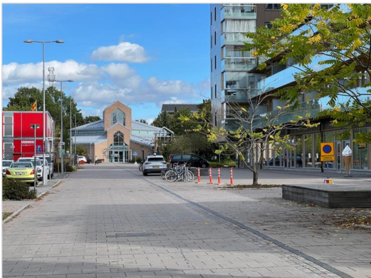
Sankt Pers kyrka sedd från Kvarntorget. De högre partierna över entrén och kyrksalen bildar en karaktäristisk siluett tillsammans med taket över den sexkantiga byggnadskroppen. Klockstapeln har samma takvinkel men är genombruten istället för att ha ett fönster.

Sankt Pers kyrka karaktäriseras av de starka relationerna mellan kyrkobyggnaden/staden och församlingshemmet/trädgården. Här finns en uppenbar ambition att platsen och byggnaden skall vara tillgängliga både för den som söker ro i vardagen eller i själen. Byggnaden vänder sig på ett närmast övertydligt sätt mot Kvarngärdets centrum i sydväst medan den nordöstra sidan är betydligt mer slutet och alldaglig. Kyrkans basilikaform och stora överljusfönster upprepas i entrén men i en mindre skala vilket, tillsammans med klockstapeln, ger byggnaden sin karaktäristiska siluett.