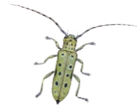
Grön aspvedbock Saperda perforata

I brynen mot öppen jordbruksmark finns lövskog med ek, lind och hassel. Grön aspvedsbock är en vacker men skygg skalbagge. Den trivs i skogar med mycket gammal asp.