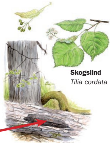
Skogslind Tilia cordata

Flera skyddsvärda arter i naturreservatet är knutna till döende och döda träd av gran, tall, lind och asp. För att dessa arter ska kunna finnas kvar på lång sikt behöver det finnas död ved i skogen. De döda träden fungerar som barnkammare för larver av olika insektsarter. När det finns insekter innebär det att fåglar, exempelvis mindre hackspett och spillkråka, hittar mat. Många svamparter behöver också ha tillgång till murkna eller döda träd för att överleva.