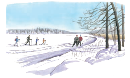
Skridsko- och skidåkning för både stora och små

För dig som vill, kan dagen avslutas med bastubad och ett uppiggande dopp i isvak.